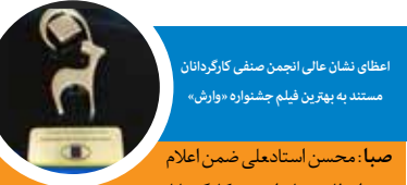
اعطای نشان عالی انجمن صنفی کارگردانان مستند به بهترین فیلم جشنواره «وارش»

صبا: هم‌زمان با استقبال روبه‌رشد علاقه‌مندان به موسیقی و سینما برای فیلم «ماموریت غیرممکن» و رسیدن آن به تبه بالای جدول فروش هفتگی سینماها، تعداد سانس‌های نمایش این فیلم در برخی از سینماها افزایش یافت. پس از ۱۵ روز از نمایش فیلم «ماموریت غیرممکن» با وجود تعداد سانس‌های کم در سینماها همچنان این فیلم گوی رقابت را برنده است. کارگردان فیلم گفته است: خوشحالم که مردم در سینما با تله‌های فیلم هم‌خوانی می‌کنند و سالن سینما لحظاتی تبدیل به کنسرت می‌شود و این یکی از اهداف من در ساخت فیلم بود و این موفقیت در حالی است که موضوع فیلم راجع به تولید ملی و فرار مغزهاست و تاکنون نه دولت و نه هیچ نهاد و ارگانی از فیلم حمایت نکرده است. امید است تا افزایش تعداد سانس‌ها به فروش بهتری دست پیدا کند. فیلم «ماموریت غیرممکن»، یک طنز اجتماعی است و به گفته کارگردان آن، این فیلم را می‌توان اولین کنسرت سینمایی ایران نام برد و در آن خوانندگان محبوب پاپ کشور همچون حامد همایون، امیرعباس گل‌اب و رضا یزدانی در نقش خود حضور دارند. برخی بازیگران این فیلم سینمایی عبارتند از: علی اوجی، پادینا رهنما، سارا خویینی‌ها، مهران رجبی، نسرین نصرتی، پوسف صیادی، سارا محمدی، عسل قرایی، پدرام ابدان و با حضور پژمان بازغی و با هنرمندی جمشیدهاشم‌پور و محمد رضا شریفی‌نیا.