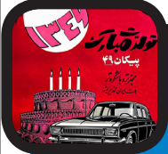
فایشگاهی از تبلیغات دهه‌های ۳۰ تا ۵۰