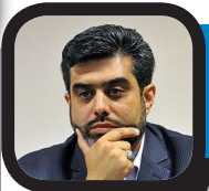
تلاش برای تاسیس انجمن‌های صنفی در آموزش هنر

مهر: «پرچار د شیردل مرده است، برادر او جان پادشاه انگلستان است. تهدید و دسیسه در سراسر اروپا حتی از سوی اشراف انگلستان و نزدیک‌ترین اعضای خانواده‌اش دیده می‌شود. کینگ جان راهی برای بالا نگه داشتن تاج پادشاهی خود ندارد.» روایت بالا بخشی از موضوع نمایش «کینگ جان» اثر ویلیام شکسپیر است که کمیانی رویال شکسپیر انگلستان قصد دارد در جدیدترین تولید خود، این نمایش را با کارگردانی الینور رود روی صحنه ببرد. نکته جالب توجه این است که کمیانی به مخاطبان خود درباره خرید صندلی‌های ردیف‌های جلوی سالن میزبان اجرای «کینگ جان» هشدار داده است. هشدار داده‌شده به مخاطبان از این قرار است: «لطفا آگاه باشید که اجرای این نمایش شامل جنگ غذا روی صحنه است و اگر شما در صندلی ردیف‌های جلوی سالن نشست باشید، راه فراری از این اتفاق نخواهید داشت.» نمایشنامه «کینگ جان» اثر شکسپیر موضوع دسیسه‌های سیاسی در دوران پادشاهی جان در انگلستان است؛ دوره‌ای که انگلستان بخش اعظمی از فرانسه را در تصرف خود داشت.