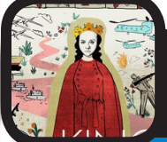
جنگ غذاروی صحنه «کینگ جان»

مهر: «پرچار د شیردل مرده است، برادر او جان پادشاه انگلستان است. تهدید و دسیسه در سراسر اروپا حتی از سوی اشراف انگلستان و نزدیک‌ترین اعضای خانواده‌اش دیده می‌شود. کینگ جان راهی برای بالا نگه داشتن تاج پادشاهی خود ندارد.» روایت بالا بخشی از موضوع نمایش «کینگ جان» اثر ویلیام شکسپیر است که کمیانی رویال شکسپیر انگلستان قصد دارد در جدیدترین تولید خود، این نمایش را با کارگردانی الینور رود روی صحنه ببرد. نکته جالب توجه این است که کمیانی به مخاطبان خود درباره خرید صندلی‌های ردیف‌های جلوی سالن میزبان اجرای «کینگ جان» هشدار داده است. هشدار داده‌شده به مخاطبان از این قرار است: «لطفا آگاه باشید که اجرای این نمایش شامل جنگ غذا روی صحنه است و اگر شما در صندلی ردیف‌های جلوی سالن نشست باشید، راه فراری از این اتفاق نخواهید داشت.» نمایشنامه «کینگ جان» اثر شکسپیر موضوع دسیسه‌های سیاسی در دوران پادشاهی جان در انگلستان است؛ دوره‌ای که انگلستان بخش اعظمی از فرانسه را در تصرف خود داشت.