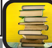
نامزدهای اولیه جایزه بیلی جی‌فورد اعلام شد