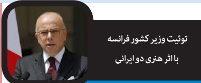
توتیت وزیر کشور فرانسه با اثر هنری دو ایرانی

صبا: موسسه تمدن‌های اسلامی فرانسه در لیون (IFCM)، با رونمایی از اثر درخت زندگی، کار دو هنرمند ایرانی افتتاح شد. در این مراسم مقامات بلندپایه فرانسه از جمله وزیر کشور و... شهردار لیون، نمایندگان سفارت جمهوری اسلامی ایران و سفرا کشورهای اسلامی حضور داشتند. اثر کانسپچوال آرت لیلافرزانه و کامران افشارنادری با نام «درخت زندگی» با ایما و چشمگیری در ورودی این موسسه توجه و تحسین‌های بسیاری برانگیخت، آن سان که وزیر کشور فرانسه، «کریستف کاستنار» توتیت خود در خصوص افتتاح این موسسه را با نمایش فیلمی از این اثر ایرانی همراه کرد. وزیر کشور فرانسه در این توتیت نوشته است: برای درک بهتر فرهنگ‌های اسلامی، باید به همگان اجازه داد تنوع دیدگاه در آن را متوجه شوند و فضایی برای تبادل و اشتراک آن داشته باشند: IFCM می‌تواند پلی بین تمدن‌ها و فلسفه‌های آن باشد که به نوعی یک فرصت و یک موفقیت است. این نوشتار با فیلمی همراه است که مطلع آن با نمایش کار درخت زندگی ایرانی آغاز می‌شود. اثر درخت زندگی دو هنرمند ایرانی تنها اثر هنری است که اکنون در موسسه تمدن‌های اسلامی لیون نصب شده و در مواردی به‌عنوان نماد این موسسه نیز به کار رفته است. اثر «درخت زندگی» پانلی از جنس کاشی منقوش دست‌ساز و فولاد آینه‌ای به ابعاد ۹،۵۰ در ۳،۵۰ است که توسط کامران افشارنادری و لیلافرزانه و تیمی متشکل از هنرمندان معماران، صنعتگران و مهندسان ایرانی در مدت یک‌سال و نیم کار بی‌وقفه تولید و در سال اصلی ورودی موسسه به‌طور دائم نصب شده است.