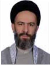
حجت‌الاسلام سیدعلی طاهری سخنگوی کمیسیون فرهنگی مجلس