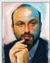
مخاطب سریال‌های امسال رمضان بیشتر از قبل بود

گفت و گوی ماندگار «پاریس ریویو» با تونی کوشنر، فیلمنامه نویس