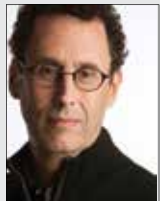
نوشتن آزاردهنده است

فیلم «جایز» در دنیا اکران عمومی شد و نظرات مختلفی در پی داشت