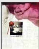
کوچک کردن دنیا به اندازه‌ی یک عکس

گفت و گویا مجید زین‌العابدین مدیر شبکه ۳ سیما و دفاع قاطع از سریال «مادرانه» برنامهی «ماه‌عسل»