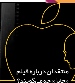
منتقدان درباره فیلم «جابز» چه می‌گویند؟

استیو جابز در بین مدیران چهره‌ای اسطوره‌ای است که توانسته انقلاب بزرگی را در دنیای فناوری ایجاد کند. هر چند جابز در طول زندگیش علاقه‌ای به آشکار کردن تجربیات شخصی زندگی‌اش نداشت اما بعد از مرگش کتابی بر اساس مصاحبات او تنظیم شد که نوشتن و تنظیم همین مصاحبه‌ها ۲ سال زمان برد. کتاب زندگی نامه استیو جابز در سال ۲۰۱۱ تبدیل به پر فروش ترین کتاب سال آمازون شد. برای جمع‌آوری اطلاعات این کتاب با بیش از ۱۰۰ نفر از اعضای خانواده، دوستان، همکاران و رقیبان استیو جابز گفتگو شده است. خبر خوب برای کتاب‌خوانان این است که این کتاب با تلاش آقای «ناصر دادگستر» در ایران به فارسی ترجمه شده است که می‌توانید با خواندن آن به دنیای تجربیات خودتان اضافه کنید.