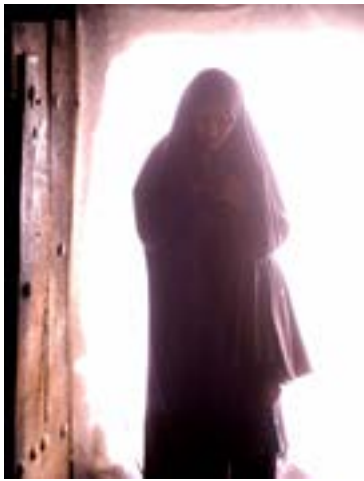
صلاح‌مندی به صبا خبر می‌دهد