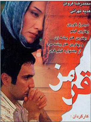
خوب بوده و نمی‌توان بهترین را در کارنامه کاری‌اش انتخاب کرد.