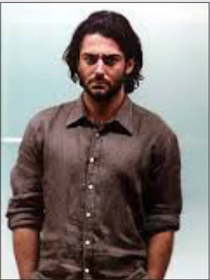
کارنامه کاری‌اش است، اما از سویی دیگر این عده عقیده دارند تمام کارهای مرضیه برومند

در آن سال‌ها جرئت زیادی می‌طلبید. اینگونه «قرمز» تبدیل به بهترین فیلم او شد. مرضیه برومند مرضیه برومند یکی از تأثیرگذارترین کارگردان‌ها در حوزه کودک است، کارگردانی که به خوبی با حال و هوای بچه‌ها آشناست و آن‌ها را می‌شناسد. فیلم‌ها و سریال‌های زیادی را در همین حوزه از او دیده‌ایم. از سریال‌هایی همچون «قصه‌های تابه‌تا» و «خونه مادر بزرگ» تا فیلم‌های سینمایی «شهر موش‌ها». بسیاری عقیده دارند که فیلم سینمایی «شهر موش‌ها» نقطه عطف