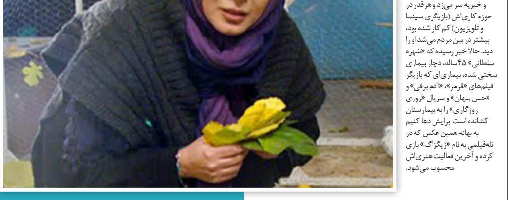
تا همین چند وقت پیش در مسابقات والیبال بانوان هنرمند شرکت می‌کرد، به مجامع عمومی خیره می‌کردم و هر قدر در حوزه کاری‌اش (بازیگری سینما و تلویزیون) کم کار شده بود، بیشتر در بین مردم می‌شد او را دید. حالا خبر رسید که «شهره سلطانی» ۴۵ ساله، دچار بیماری سختی شده، بیماری‌ای که بازیگر فیلم‌های «قرمز»، «ادم برفی» و «حس پنهان» و سریال «روزی روزگاری» را به بیمارستان کشانده است. برایش دعا کنیم به بهانه همین عکس که تله‌فیلمی به نام «پیکرک» بازی کرده و آخرین فعالیت هنری‌اش محسوب می‌شود.