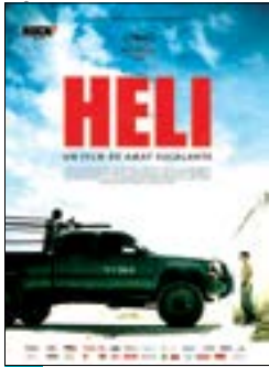
پوسته فیلم «هلی»

آن چه «هلی» به ما ارائه می دهد یک وحشت فراواقع گرانه و رام شدگی محسوس است، تلفیقی از سنگ تیره و قساوت آلود «اسکالانت» منتج می شود. زندگی «هلی» در حالت طبیعی و ساده ترین شکل ممکن ادامه می یابد. در این فیلم، کارگران از هیچ بازیگر حرفه ای استفاده نکرده و تمام بازیگران به جز نقش پدر، برای بار اول است که در یک فیلم حضور می یابند و این واقعا به طبعی بودن و واقعی جلوه کردن فیلم کمک بسزایی کرده است. «اسکالانت» با استفاده از تلفیق ویژگی های ضد واقعیت و فیض در پی استحکام بخشیدن به بنای آن است. او با نمایش شرارت و هرج و مرج می خواهد به نوعی نظم و رستگاری دست یابد. در مجموع، فیلم بسیار ناراحت کننده و هشدار دهنده و تأثیر گذار است که بیننده را در نوعی زجر و لذت از تماشای آن غرق می کند.