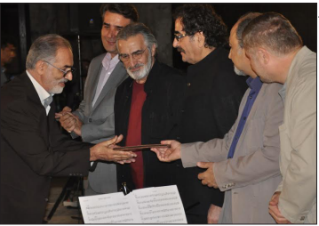
کسروان از ما جدا نشد به خود می‌بایم. وی افزود: ما در زمان جنگ در دو جبهه متفاوت و متضاد با هم در جنگ بودیم یک جبهه‌ای که هنوز هم وجود دارند که موسیقی را به طور کامل حرام می‌دانستند و در آن زمان به من به عنوان مسئول موسیقی کشور فشار می‌آوردند که باید موسیقی تعطیل شود و یک جبهه دیگر که با انقلاب هم قدم