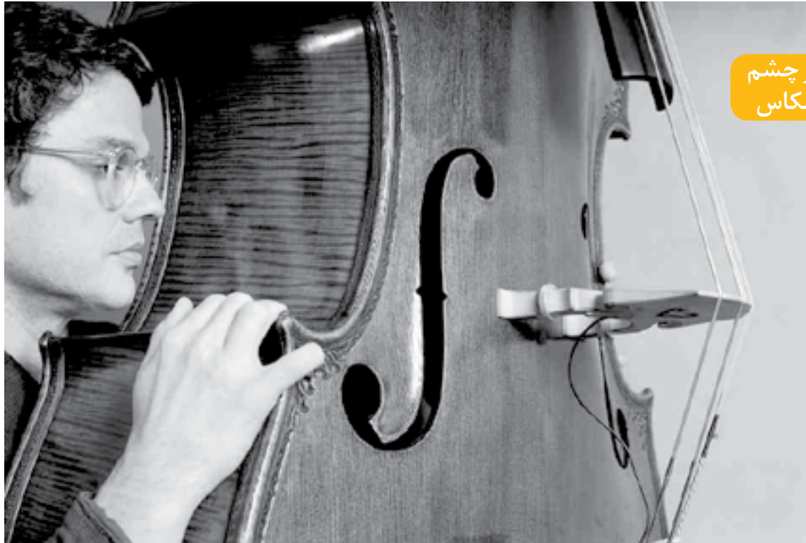
نام چارلی هدن و موسیقی جاز به هم گره خورده و جدایی هدن از جاز باور پذیر نیست، اما جای تأسف است که دیگر صدای ساز چارلی هدن برای همیشه خاموش شده است. چارلی هدن دیروز در سن ۷۷ سالگی در گذشت و عکس امروز به احترام اوست.