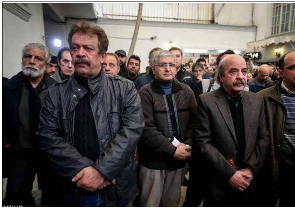
عظمت در تک تک پلان های