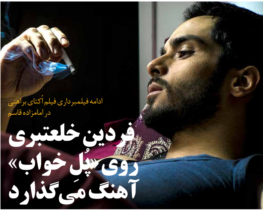
ادامه فیلمبرداری فیلم اکتای براهنی در امامزاده قاسم

«سوته‌زار»، ۵ پرسوناژ اصلی دارد و در تهران و یک شهرستان، جلوی دوربین می‌رود. وی افزود: روز گذشته، بازنویسی نهایی فیلمنامه را به اتمام رساندم و طی هفته آینده، تقاضای پروانه ساخت این فیلم سینمایی را به سازمان سینمایی، ارائه خواهیم داد.